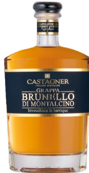
Castagner Grappa Brunello di Montalcino