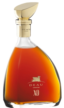
Moisans Deau Cognac Gloria XO