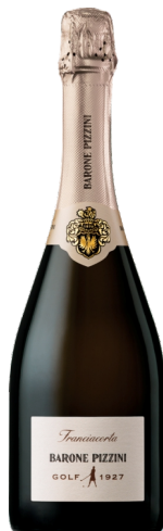
Franciacorta Brut Golf 2019