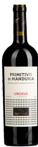
Primitivo di Manduria Urceus

Kantina: Cantolio Rajoni: Puglia Variateti: Primitivo Vëllimi: 0.75L / Alkoli: 14%