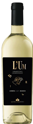
Lungarotti L'um Bianco