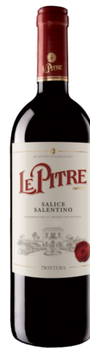
Salice Salentino Le Pitre