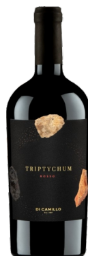
Di Camillo Triptychum Rosso

Kantina: Di Camillo Rajoni: Abruzzo Variateti: Montepulciano d'Abruzzo, Nero d'Avola, Primitivo