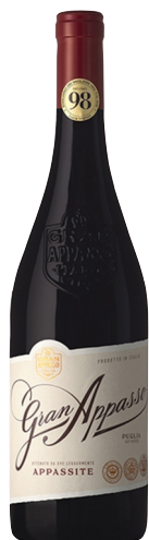
Gran Appasso Rosso

Kantina: Femar Vini Rajoni: Puglia Variateti: Pinot Noir