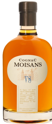
Moisans Cognac VS