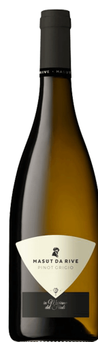
Masut Da Rive