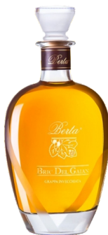
Berta Grappa Invecchiata Bric Del Gian