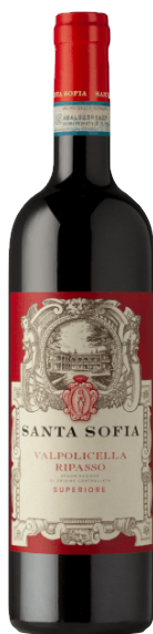
Ripasso Superiore Kantina: Santa Sofia Rajoni: Veneto Varieteti: Corvina, Rondinella, Molinara Vëllimi: 1.5L / Alkoli: 13.5% 15.000 Lekë