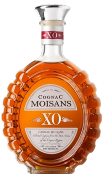
Moisans Cognac XO Micray