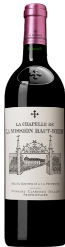
La Chapelle de La Mission Haut-Brion 2014