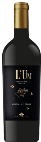
Lungarotti L'UM Rosso