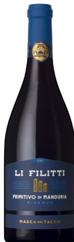
Li Filitti Riserva