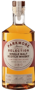
Parkmore Single Malt Scotch Whisky Vjetërimi: 7 Vite Përbërësit: Me Lule, Fruta, Pikant