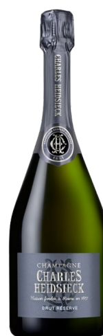
Champagne 12 Brut Reserve