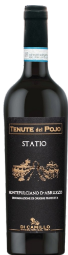
Di Camillo Del Pojo Statio

Kantina: Di Camillo Rajoni: Abruzzo Variateti: Montepulciano Vëllimi: 0.75L / Alkoli: 13.5%