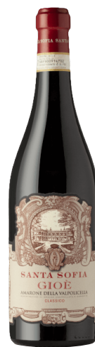
Amarone della Valpolicella Gioè