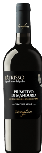
Patrisso Primitivo di Manduria