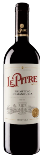
Primitivo di Manduria Le Pitre