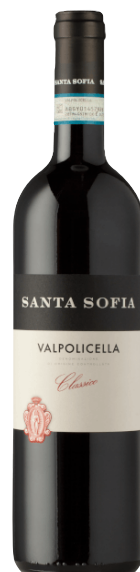
Valpolicella Classico Kantina: Santa Sofia Rajoni: Veneto Varieteti: Corvina, Rondinella, Molinara Vëllimi: 1.5L / Alkoli: 12.5% 28.000 Lekë