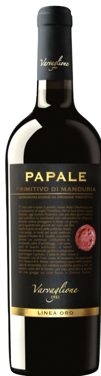
Papale Primitivo di Manduria Kantina: Varvaglione Rajoni: Puglia Varieteti: Primitivo Vëllimi: 6L / Alkoli: 14.5% 54.000 Lekë