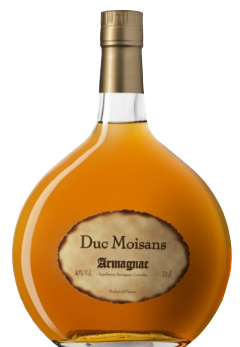
Moisans Duc Moisans Armagnac