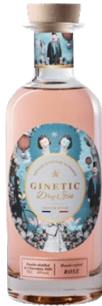
GINETIC ROSE GIN