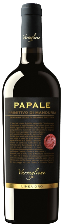
Papale Primitivo di Manduria Kantina: Varvaglione Rajoni: Puglia Varieteti: Primitivo Vëllimi: 3L / Alkoli: 14.5% 34.000 Lekë