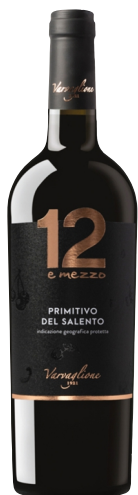
Primitivo del Salento 12 e mezzo

Kantina: Varvaglione Rajoni: Puglia Variateti: Primitivo