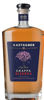
Castagner Grappa Riserva Invecchiata in Barrique di Ciliegio