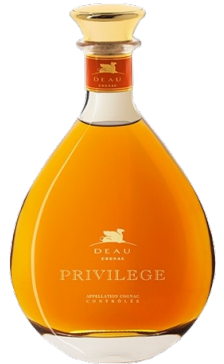
Moisans Cognac VS Organic Privilege