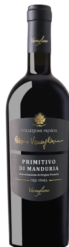
Primitivo di Manduria Cosimo Varvaglione Collezione Privata