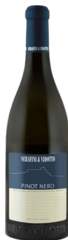
Pinot Nero Igt del Veneto