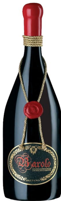
Barbaresco Magnum Kantina: Salvano Rajoni: Piemonte Varieteti: Nebbiolo Vëllimi: 3L / Alkoli: 14.5% 58.000 Lekë