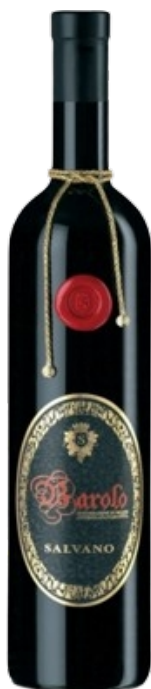
Barolo Magnum Kantina: Salvano Rajoni: Piemonte Varieteti: Nebbiolo Vëllimi: 1.5L / Alkoli: 14.5% 45.000 Lekë