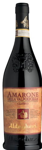
Amarone della Valpolicella Classico