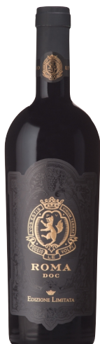
Roma Rosso Edizione Limitata