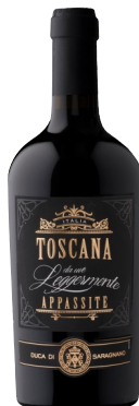
Toscana Appassite Rosso

Kantina: Barbanera Rajoni: Toscana Variateti: Merlot, Sangiovese, Cabernet Sauvignon