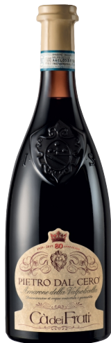
Amarone della Valpolicella Pietro dal Cero