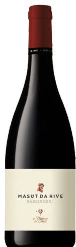
Masut Da Rive Sassirossi