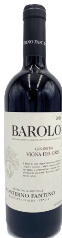
Barolo 'Ginestra - Vigna del Gris'