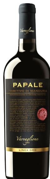
Papale Primitivo di Manduria Kantina: Varvaglione Rajoni: Puglia Varieteti: Primitivo Vëllimi: 1.5L / Alkoli: 14.5% 25.000 Lekë