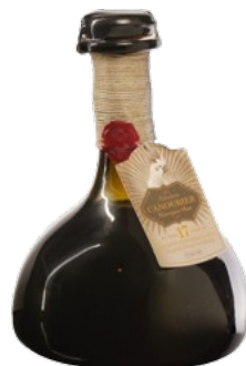
Canoubier Rhum du Nicaragua